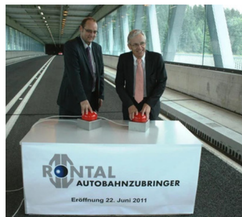
Bridge Drainage units vanaf het wegdek

Afdeling Techniek +31 (0)6 11 90 25 50 erik@bridge-drainage.com