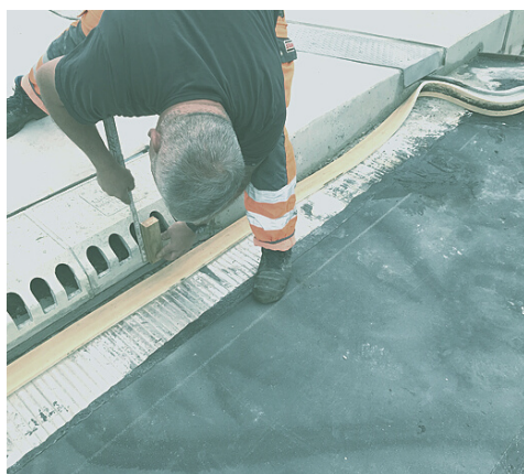
Uitleg op locatie