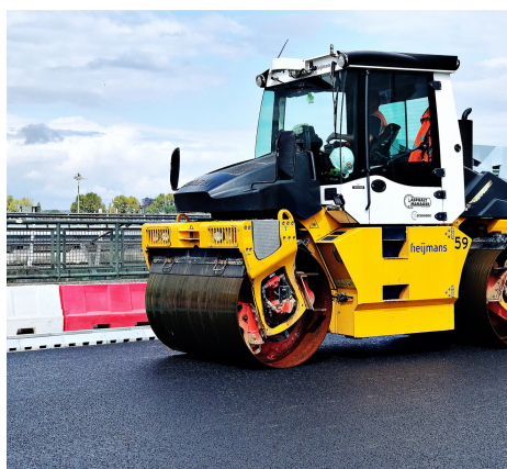
Integratie afwatering in middenberm

Het afwateringsprobleem van deze brug werd volledig opgelost met de Bridge Drainage units . Door de integratie van de afwatering in de banden kon deze bestaande brug 80 cm slanker gerealiseerd worden. Tevens zal het onderhoud van het afwateringssysteem volledig op het brugdek kunnen plaatsvinden. Daarnaast werd er in de bandenlijn van de afwatering 300% gewicht bespaard .